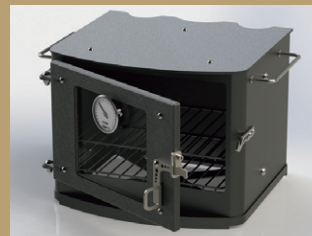
ガラスドアオープン

ストーブトップで調理ができるだけでなく、乗せるだけでクッキングストーブに早変わり。お好みのデザインをセレクト可能。 ※継続使用時でも最大温度は240℃程度となります。 ●各¥88,000(税込)