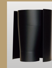
ADVENTURER 5 専用異径アダプター (φ100→150)