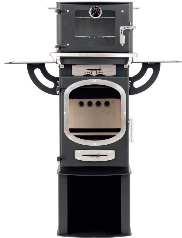
●フルオプション ウォーミングシェルフ(左・右) +ステンレスレール+オープン(ガラス)