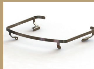
ステンレスレール

ステンレスのアクセントでワンランク上のデザインに。ケトルや調理器具の不意の脱落を防ぐことができます。 ●¥16,500(税込)