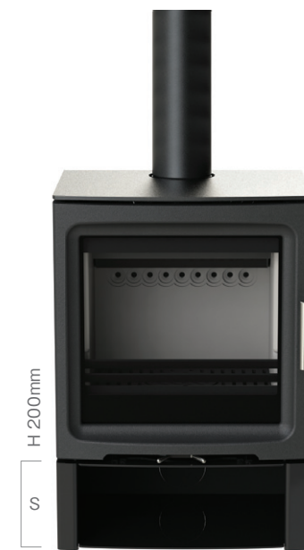
PV5W ログストア Sサイズ (オプション)