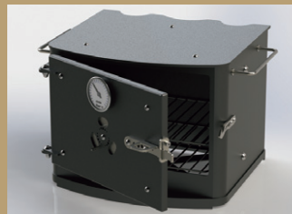
メタルドアオープン

ストーブトップで調理ができるだけでなく、乗せるだけでクッキングストーブに早変わり。お好みのデザインをセレクト可能。 ※継続使用時でも最大温度は240℃程度となります。 ●各¥88,000(税込)