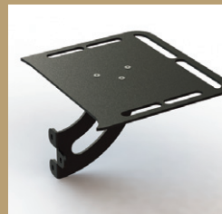
ウォーミングシェルフ(右)

ストーブから放出される熱を利用して、お料理の余熱調理や保温に。フックポイントを備え、工夫次第で様々なツールを吊り下げることが可能。 ●各¥16,500(税込)