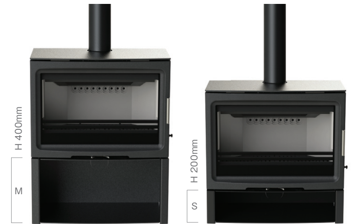
PV85 ログストア Mサイズ (オプション)