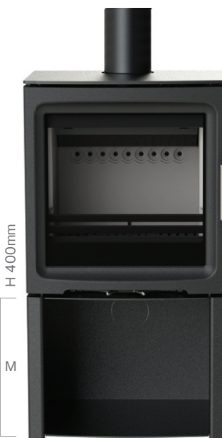
PV5W ログストア Mサイズ (オプション)