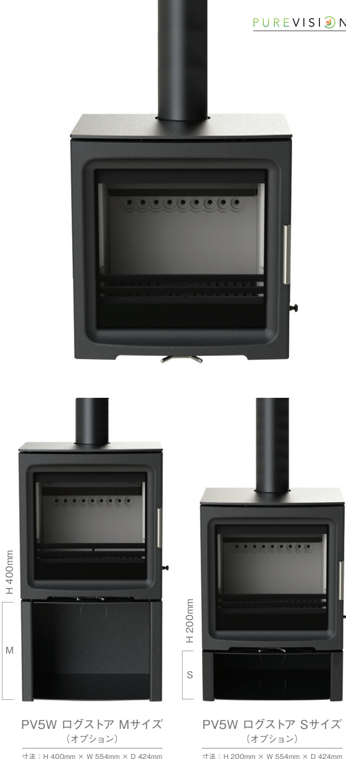
PV5W ログストア Mサイズ (オプション)