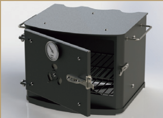
メタルドアオープン

ストーブトップで調理ができるだけでなく、乗せるだけでクッキングストーブに早変わり。 お好みのデザインをセレクト可能。 ※継続使用時でも最大温度は240℃程度となります。 ●各¥88,000 (税込)