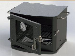
ガラスドアオープン