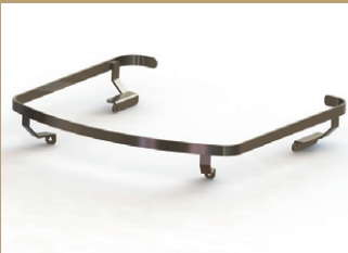
ステンレスレール

ストーブトップで調理ができるだけでなく、乗せるだけでクッキングストーブに早変わり。 お好みのデザインをセレクト可能。 ※継続使用時でも最大温度は240℃程度となります。 ●各¥88,000 (税込)