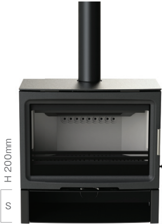
PV85 ログストア Sサイズ (オプション)