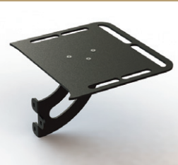
ウォーミングシェルフ (右)

ストーブから放出される熱を利用して、お料理の余熱調理や保温に。フックポイントを備え、工夫次第で様々なツールを吊り下げることが可能。 ●各¥16,500 (税込)