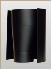
ADVENTURER 5 専用異径アダプター (φ100→150)

ストーブから放出される熱を利用して、お料理の余熱調理や保温に。フックポイントを備え、工夫次第で様々なツールを吊り下げることが可能。 ●各¥16,500 (税込)