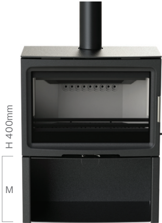
PV85 ログストア Mサイズ (オプション)